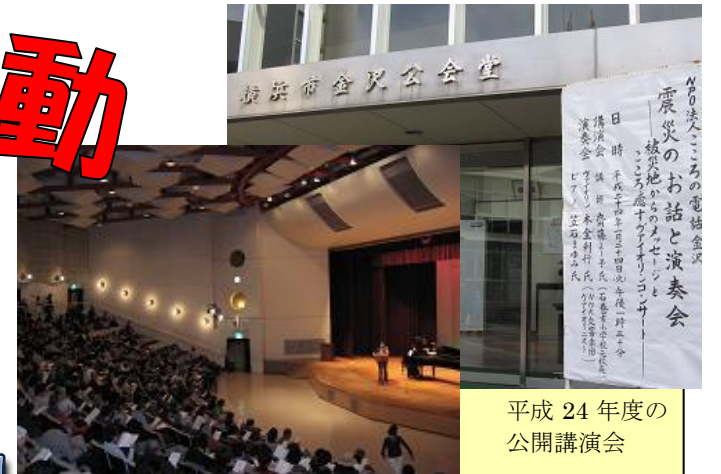
平成 24 年度の公開講演会